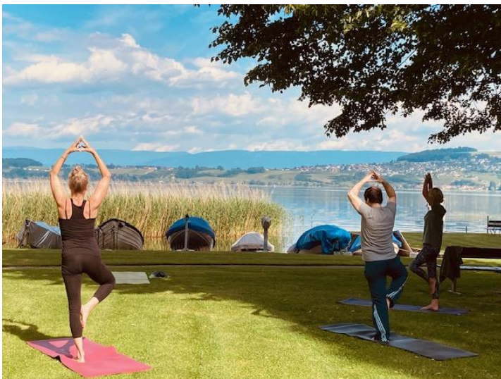
Yoga am See Donnerstagmorgen