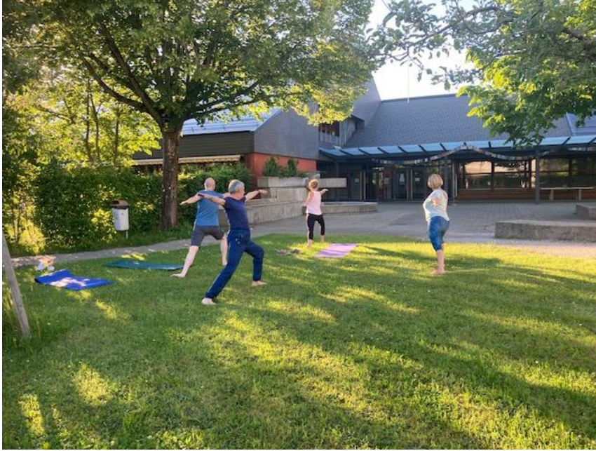
Yoga am Montagabend beim Oberstufenzentrum Allenlütten