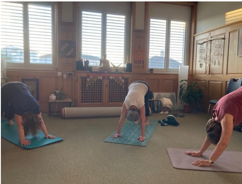
Yoga im Uebergangsraum bei Roland am Dienstagabend in Murten