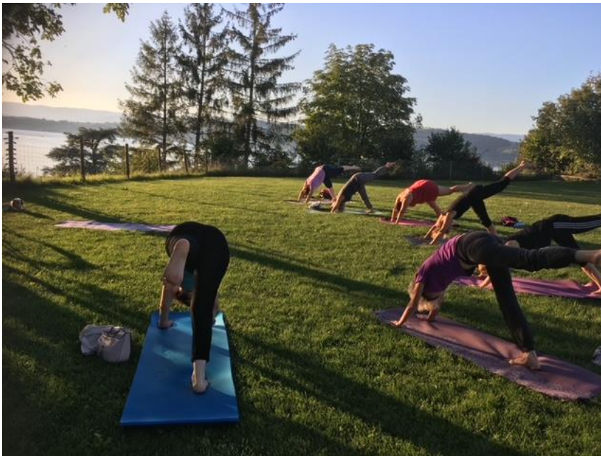
Yoga auf dem Kanonenmätteli am Dienstagabend in Murten